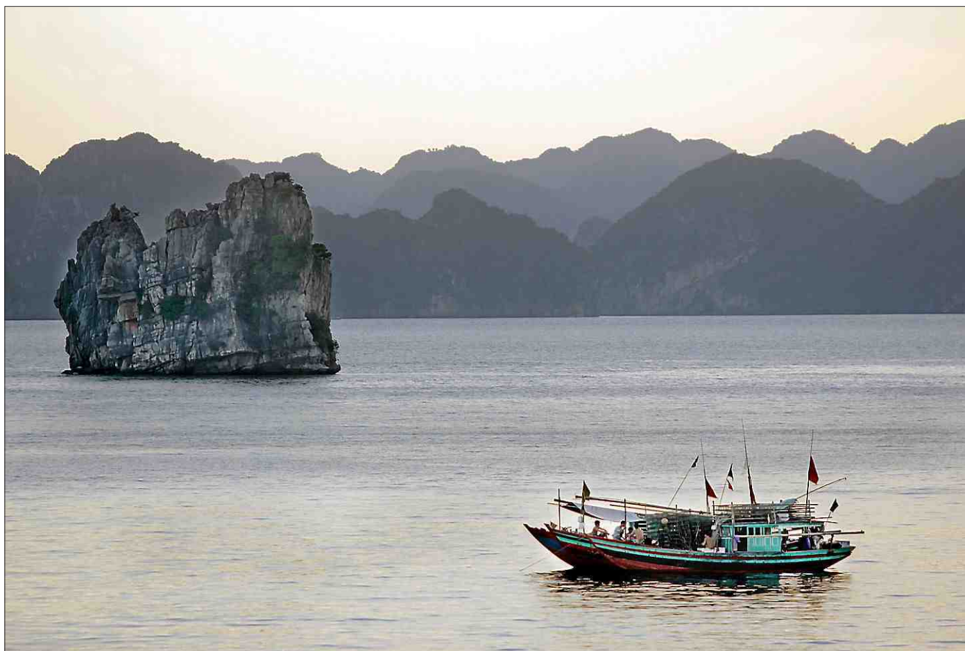
■ La majestueuse baie d'Ha Long, avec sa lumière si particulière au petit matin. Une croisière exceptionnelle.

L'Indochine est un pays qui n'existe plus que dans les livres d'Histoire. Les noms évocateurs des provinces du Tonkin, de l'Annam, et de la Cochinchine ne sont plus employés. Pourtant, ce découpage administratif français a malgré tout survécu à l'indépendance du pays. À l'instar de l'ancienne colonie, un clivage traditionnel sépare le nord et le sud. Accents, styles de vie différents, les trois mégapoles historiques du Vietnam se toisent : Hanoï l'austère et la sérieuse contre Saigon l'exubérante, la bouillonnante avec son quartier chinois de Cholon. Entre les deux, pour mieux les tenir à distance, Da Nang, ex-Tourane avec ses plages de sable blanc, non loin de l'ancienne capitale impériale Hué. Aujourd'hui, le Vietnam attire de plus en plus de touristes à la recherche de séjours authentiques, faits de rencontres et de découvertes, loin des plages bondées de Bali, ou de Thaïlande. Avec la diversité des paysages, les atouts du pays sont indéniables : plages, plaines côtières, rizières dans les deltas, moyenne montagne, et hauts plateaux. Les structures sont en place avec, aux commandes, de nombreux Français partis à la conquête de ce nouvel el dorado qu'il convient de découvrir au plus vite.