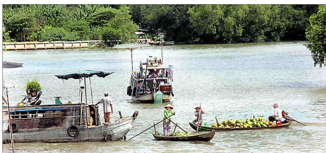
■ Sur le fleuve, les producteurs vendent directement les fruits et légumes aux bateaux de passage.

un planteur de riz. Ici, tout pousse, le delta est fertile. » Le Bassac poursuit sa croisière et remonte lentement le Mékong. Il croise des sampans remplis de divers fruits et légumes colorés et parfumés. Le delta est considéré comme « le grenier à riz » du Vietnam. Dans les villes, les marchés flottants sont très riches, mais tendent à disparaître face à la concurrence de la route, moyen jugé plus pratique pour acheminer les marchandises et des nouveaux ponts qui passent au-dessus de la tête des dragons.